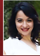
ESRA ÖZ CNN Türk Köşe Yazarı, Bilim ve Sağlık Habercisi