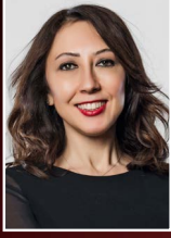
ELİF ÇELİK Eczacıbaşı Holding Sağlık Grubu Başkanı